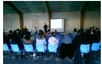
Atelier insertion pour les femmes

L'antenne intervient auprès de 400 familles environ réparties sur l'ensemble de ce secteur. Ce sont des familles sédentaires et/ou itinérantes, avec des modes de vie divers, allant du stationnement précaire à la sédentarisation en maison.